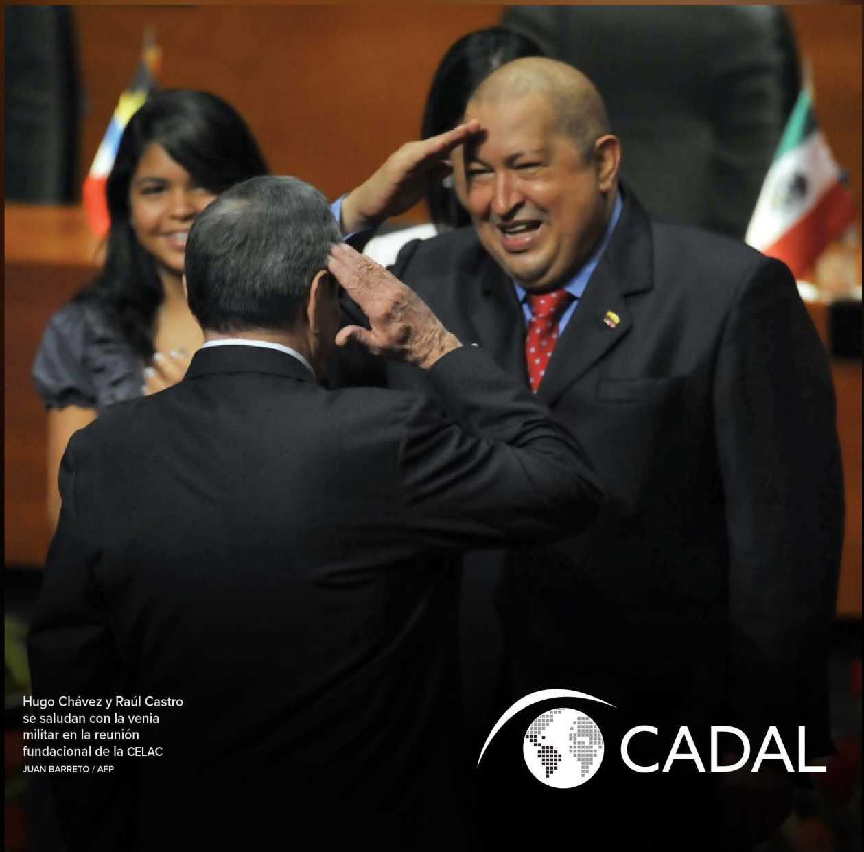
Hugo Chávez y Raúl Castro se saludan con la venia militar en la reunión fundacional de la CELAC